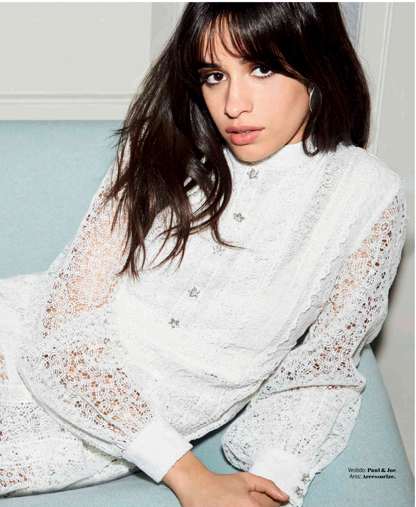
Vestido: Paul & Joe. Aros: Accessorize.