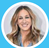
Saron Jessica Parker