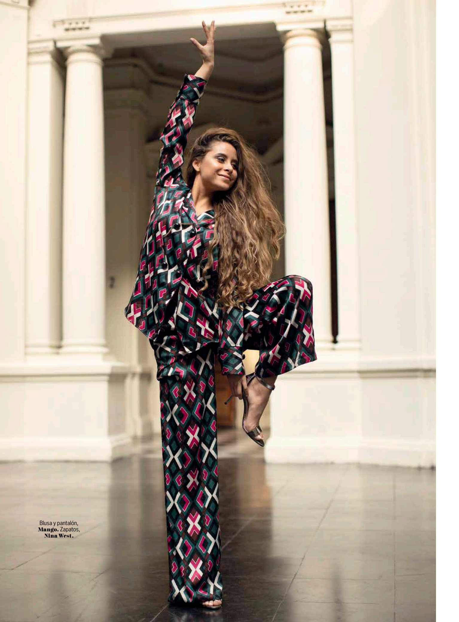
Blusa y pantalón, Mango. Zapatos, Nina West.